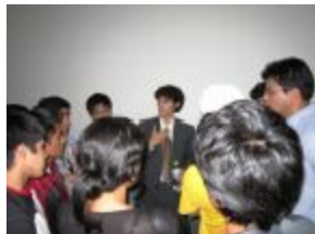
Debatiente teísta respondiendo las preguntas del público luego del debate