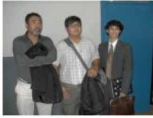
Los debatientes y el moderador