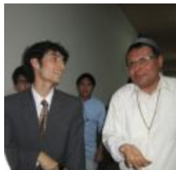
Debatiente teísta conversando con musulmán asistente al evento