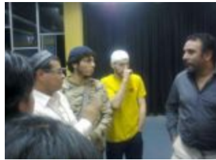
Debatiente ateo con los representantes del Islam